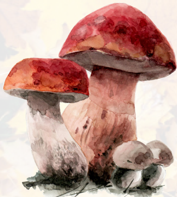
Bolets des pins

Depuis plus de 40 ans, le CPIE initie à l'environnement en développant les facultés d'observation et en donnant les bases d'analyse permettant à chacun de déterminer consciemment et en responsable son attitude vis-à-vis de son cadre de vie, à travers : des séjours scolaires, des animations à la journée, des week-ends à thème et des séjours « nature » pendant les petites et grandes vacances.